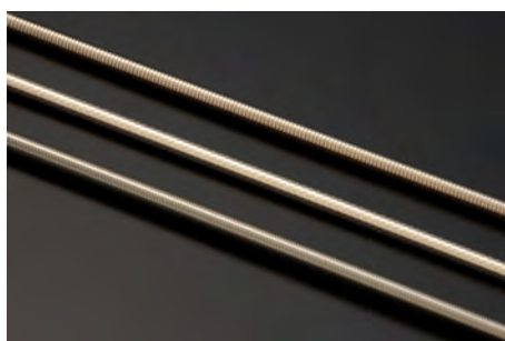
補強技術 編組・コイル巻