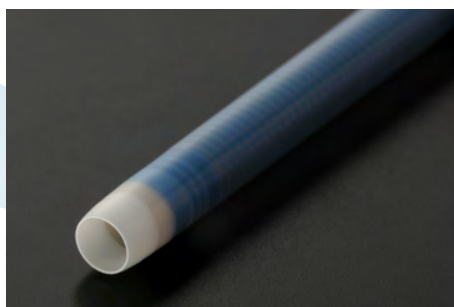
先端加工技術 テーパー、R加工