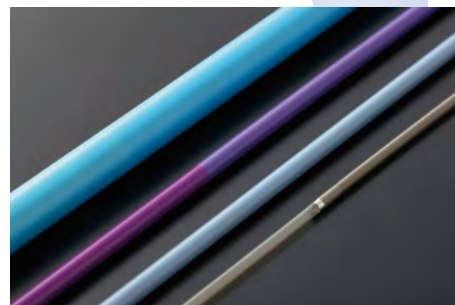
多層化技術 積層・連結